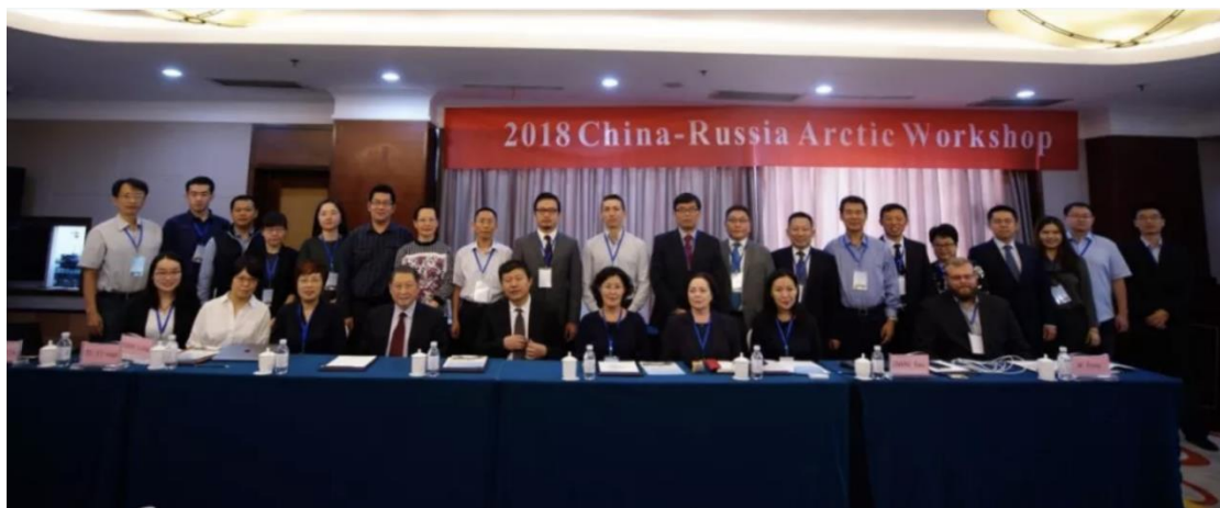
举办中俄北极论坛

极地团队是国内极地领域最重要的团队之一，参与了国内极地白皮书以及国家多项极地方面的立法及规划的编写，创立了中俄学术界唯一的常规化和制度化交流平台——中俄北极论坛，是国内最早加入北极大学联盟的高校，设有“国际极地与海洋门户”网站 ( www.polaroceanportal.com )，吸引了中国和北极国家绝大部分一流的北极学者 (参见网站“研究团队”和“顾问团队”)。