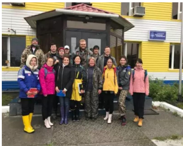
团队研究生赴俄罗斯参与2018年“国际北极夏令营”