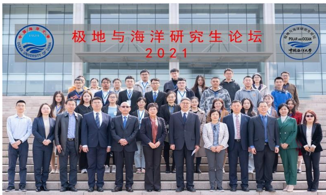
举办极地海洋研究生论坛

十年来，中国海洋大学极地研究团队依托学校极地研究的跨学科联合创新优势和业已建立的国家极地战略决策和规划、立法等重要咨议智囊平台优势，充分利用国际交流层次高、密度大的特长，打造了国家极地立法与政策制定的核心智库团队，目前正向着建设成为国家级极地战略核心智库、国家海洋与极地管理事业人才培养基地、国际一流的极地人文社会科学研究中心、极地问题国际交流中心和桥头堡的目标不断迈进。