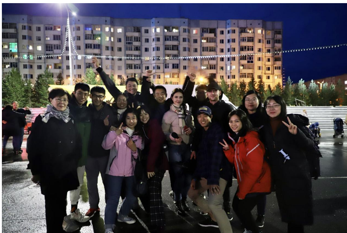
团队成员赴俄罗斯参与2019年“国际北极夏令营”

在国内层面，在学校与两个学院的支持下，团队学生在第九届中俄北极论坛、北极前沿问题学术研讨会、第五届全国俄罗斯--欧亚研究高级研修班、第五届全国国际关系研究生学术论坛、国际关系学院学术论坛、现代国际关系青英论坛、中国海洋大学“极地与海洋研究生论坛（2021）”等学术活动中取得优异成绩。在极地团队各位老师的指导下，团队学生在《国际问题研究》、《现代国际关系》、《东北亚研究》、《太平洋学报》、《国际论坛》、《俄罗斯研究》、《东岳论丛》等知名中文核心期刊发文多篇；并多次获得研究生国家奖学金、研究生学业奖学金和学术奖学金等。